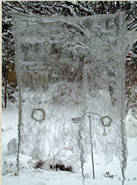
Gardine und Lichtobjekte