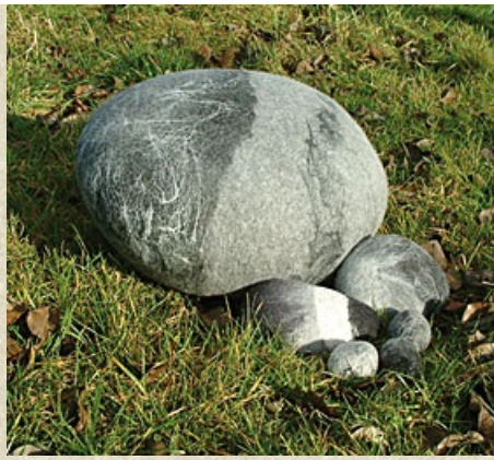
Sitzstein und Filzkiesel