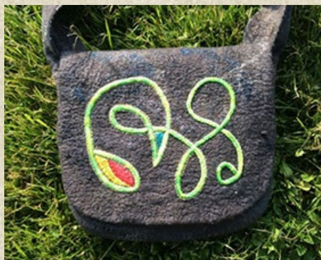
Bestickte Filztaschen aus Afghanistan: Modernes Design von Kursteilnehmerin