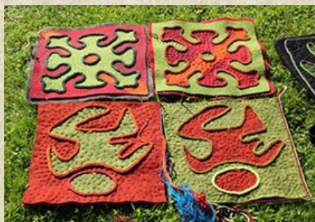
Shirdak aus Kirgistan: Sitzkissen von 4 Kursteilnehmerinnen