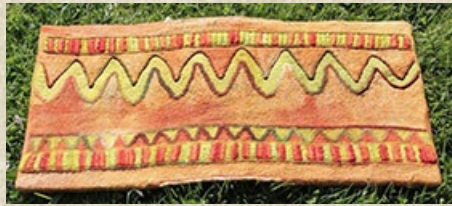
Turkmenische Technik: Buchhülle von Kursteilnehmerin