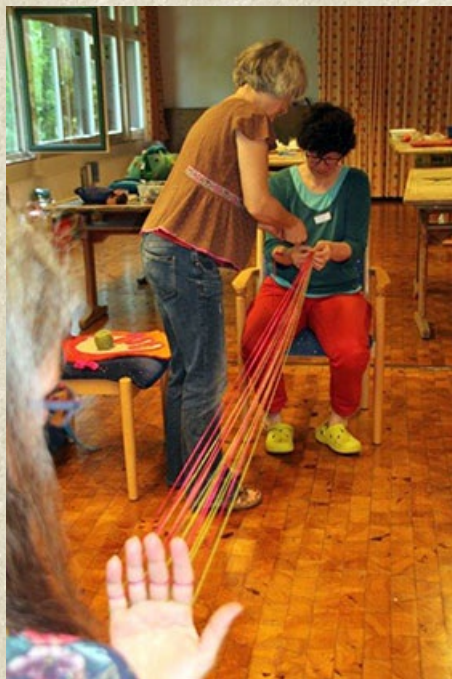
Shirdak: Kabolisch Weben