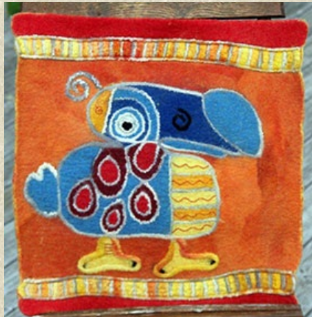
Turkmenische Technik: Sitzkissen von Kursteilnehmerin