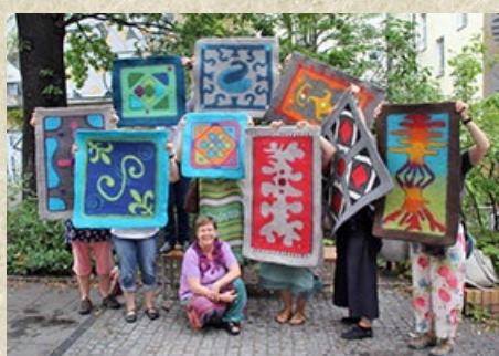
Turkmenische Teppiche oder Sitzkissen: Filzteppiche Filzfestival Berlin